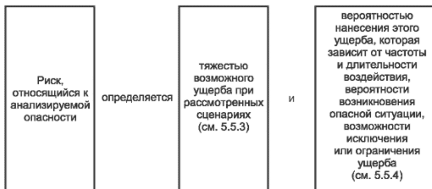
Рисунок 3 - Риск и его составляющие

5.5.2.2 Составляющие риска приведены на рисунке 3.