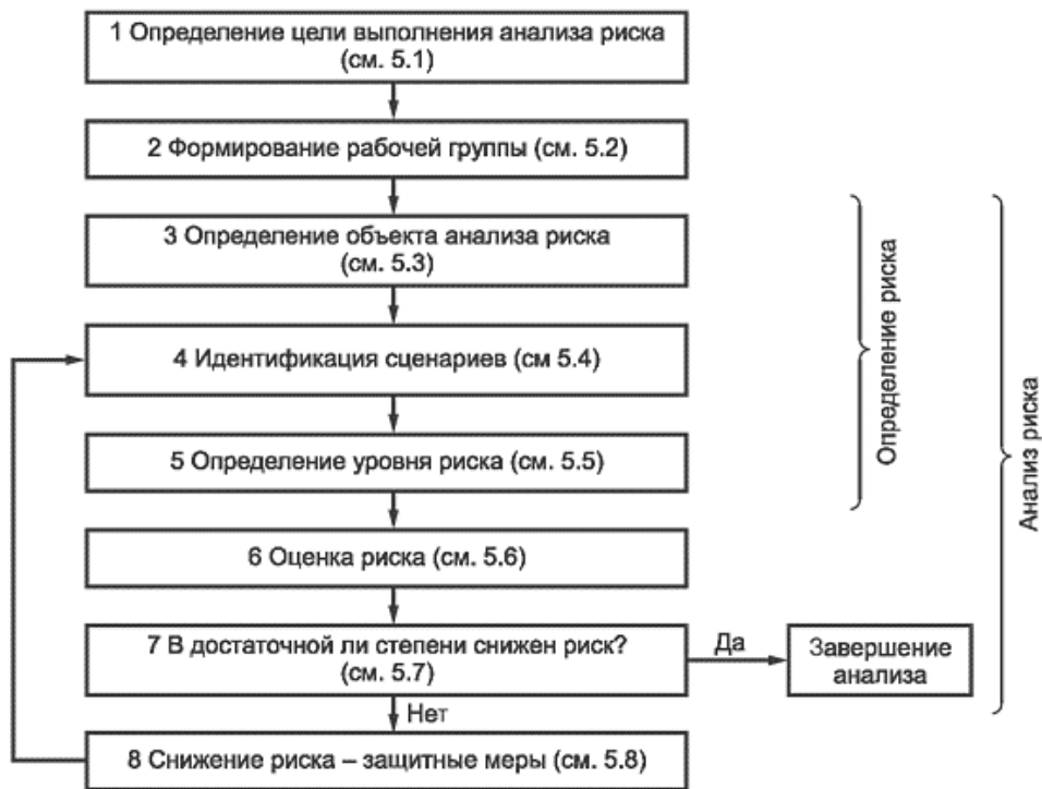
Рисунок 1 - Схема выполнения анализа и снижения риска

При повторении этого процесса достигается устранение опасности или применяются защитные меры.